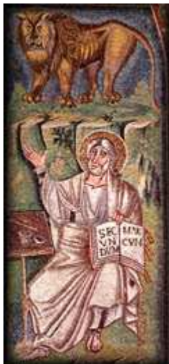
The lion is the symbol for the gospel of Mark

binevestind și propovăduind cuvântul lui Dumnezeu. Acolo închinătorii idolilor nesuferind a vedea sporin-du-se credința în Hristos, l-au legat cu ștreanguri și l-au târât, și carnea pe pietre se zdrelea și sângele lui roșia pământul.